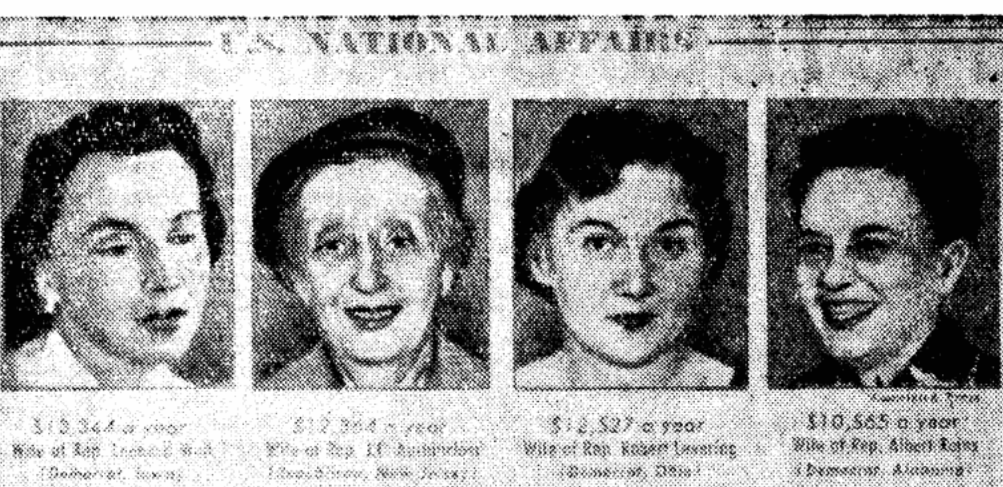
Журнал «Ньюсик» поместил несколько фотографий ненасытных жен конгрессменов, кормящихся за счет налогоплательщиков. Под каждым портретом — точная сумма украденных долларов. Весьма примечательно, что портреты вороватых дам даны под постоянной рубрикой журнала «Национальные дела США». Ну и дела!

Такое же любовное, заботливое отношение к своим вторым «я» проявляют многие конгрессмены. Когда разразился скандал, выяснилось, что 125 родственников членов высшего законодательного органа США кормятся и на-